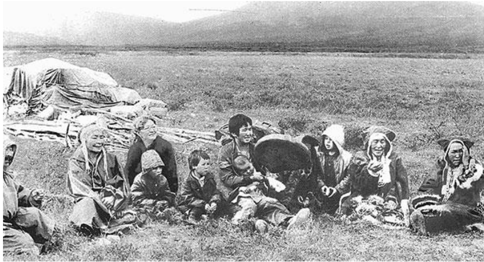
Жители села Ваеги в тундре.

Меховые палатки, отапливаемые зимой печками, появились в Корякин впервые в 1950-е гг. и были быстро переняты ваежскими оленеводами, ведь дрова у них, как и у коряков, всегда под рукой. За форму этого жилища хатырские чукчи называли ваежских «вычгыралъыт» («поскожилищные»).