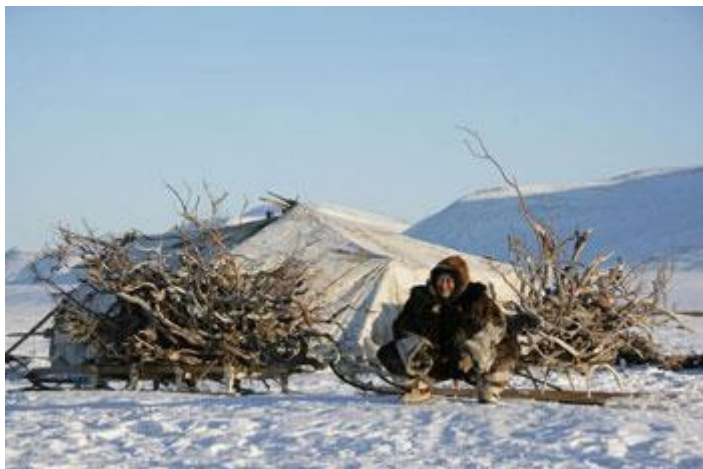
Фото Лемешева. К

Вверху, ближе к дымовому отверстию, еще один ряд перечных перекладин. Деревянный остов яранги покрывали (мехом наружу) шкурами оленей, сшитыми обычно в 2 полотнища. Края шкур накладывали один на другой и скрепляли пришитыми к ним ремнями.