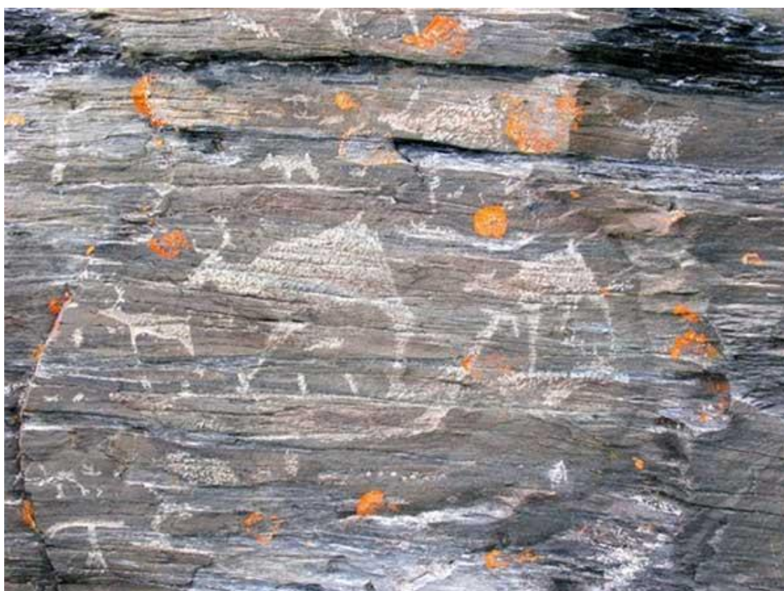
рис 2. Группировка наскальных рисунков на Пегтымыле (по Н.Н. Диков, 1969)