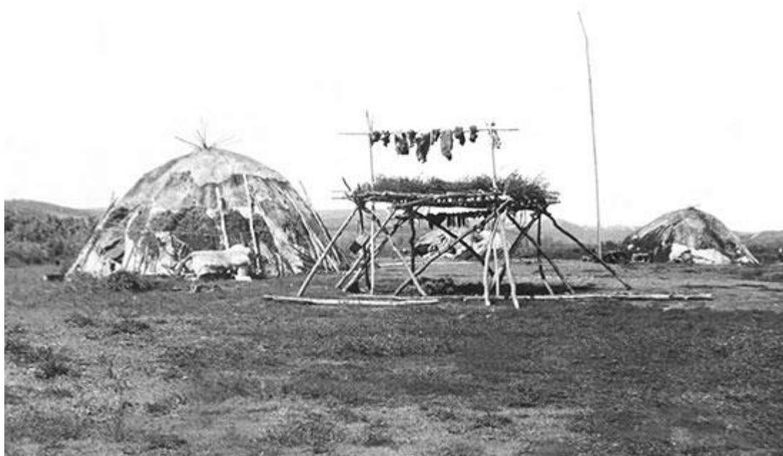
рис 4. Летняя стоянка оленеводов рамай или анольятынвын совхоза «Путь к коммунизму» (фото И. Дылев, 1980-е)

день проводили другой праздник анольят (смотрите выше анольятынвын) — вновь строили ярангу на «НОВОМ МЕСТЕ» и проводили обряд ранъйрав — освящали «новое жилище» кровью священного оленя. Ведь после долгих непрерывных зимних кочевок женщины, дети и старики наконец на пять месяцев будут оставаться на месте. Женщины за лето сошьют новые одежды, старики починят нарты для будущих зимних кочевок, а дети будут набираться сил и в играх постигать навыки оленней жизни.