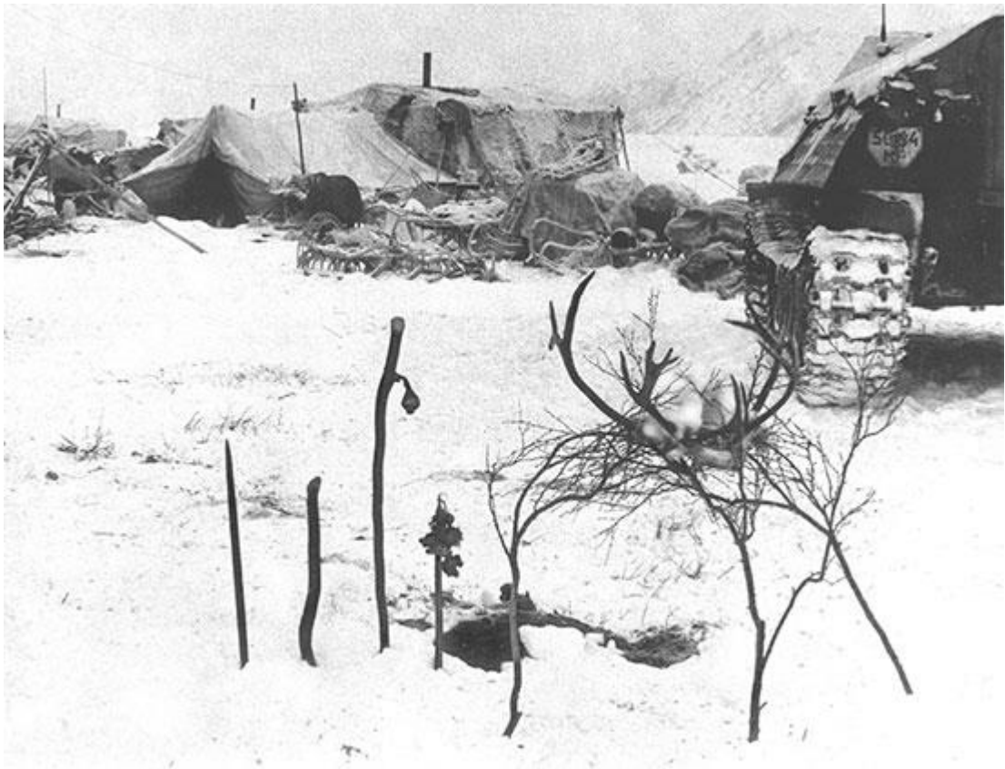
рис.2. Священный убой «верхним существам». Ритуальные предметы (бр. № 6 совхоз «Путь к коммунизму», с. Ваеги, 198...) на переднем плане слева на право: символические копье, червь или змея, посох с привязанным камнем, связка тайн'ыквыт, на верхушках трех веток установлены рога оленя .