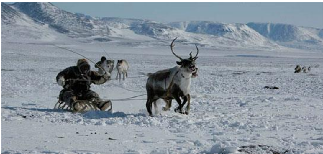
рис 3 . Оленьи гонки в бр. № 9 МУП СХП «Чаунский». Финиш Б. Ф. Вуквукая

В каждой бригаде, где заканчивали отбивку, устраивали спортивные состязания. Самое интересное событие — гонки на оленьих упряжках (рис 3). К ним готовились всю зиму: подбирали упряжку, тренировали оленей. Обучить оленя, и тем более подобрать хорошую упряжку, — дело нелегкое, требующее терпения и навыков. Старики говорили: «Не злись на оленя, если что-то не получается!» Тем более не допускалось ударить животное. Взбунтовавшегося оленя можно было усмирить лишь с помощью чиглэткун. Для этого на конец узды закреплялся чикыл. Это деревянный, похожий на небольшую палицу предмет, который придавал резкость продергиванию узды.