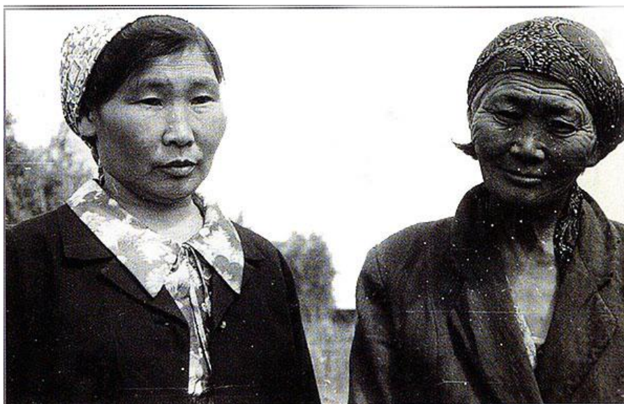
Негидальки, двоюродные сестры по материнской линии, снимок сделан 1970, село Владимировка.

Православные священники совершали таинство крещения и давали новообращенным другие имена и фамилии. Так среди «людей, живущих по берегам рек», появились Евдокимовы, Надеины, Соловьевы, Семеновы, Яковлевы, Максимовы. Более 85 % негидальцев были крещены.