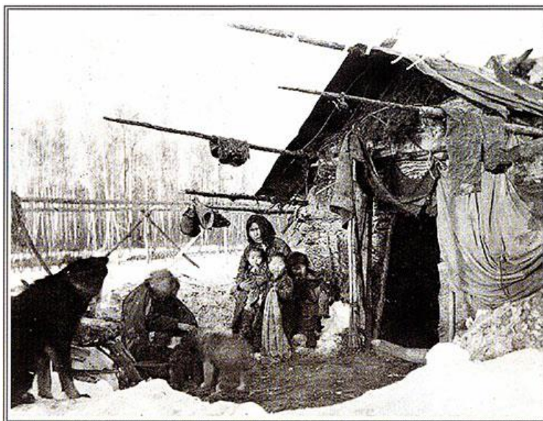
Женщины кормят собак около берестяного балагана. Уссурийский край, Хабаровский край, 1920-е годы.

впадающим в озеро Чукчагир, Удыль, у озер Орель, Чля (левобережье Амурского лимана), по реке Тугур, впадающей в Тугурский залив Охотского моря. Как гласит предание озеро Чукчагир ( Чукчакил) названо в честь утонувшей в озере шаманки.