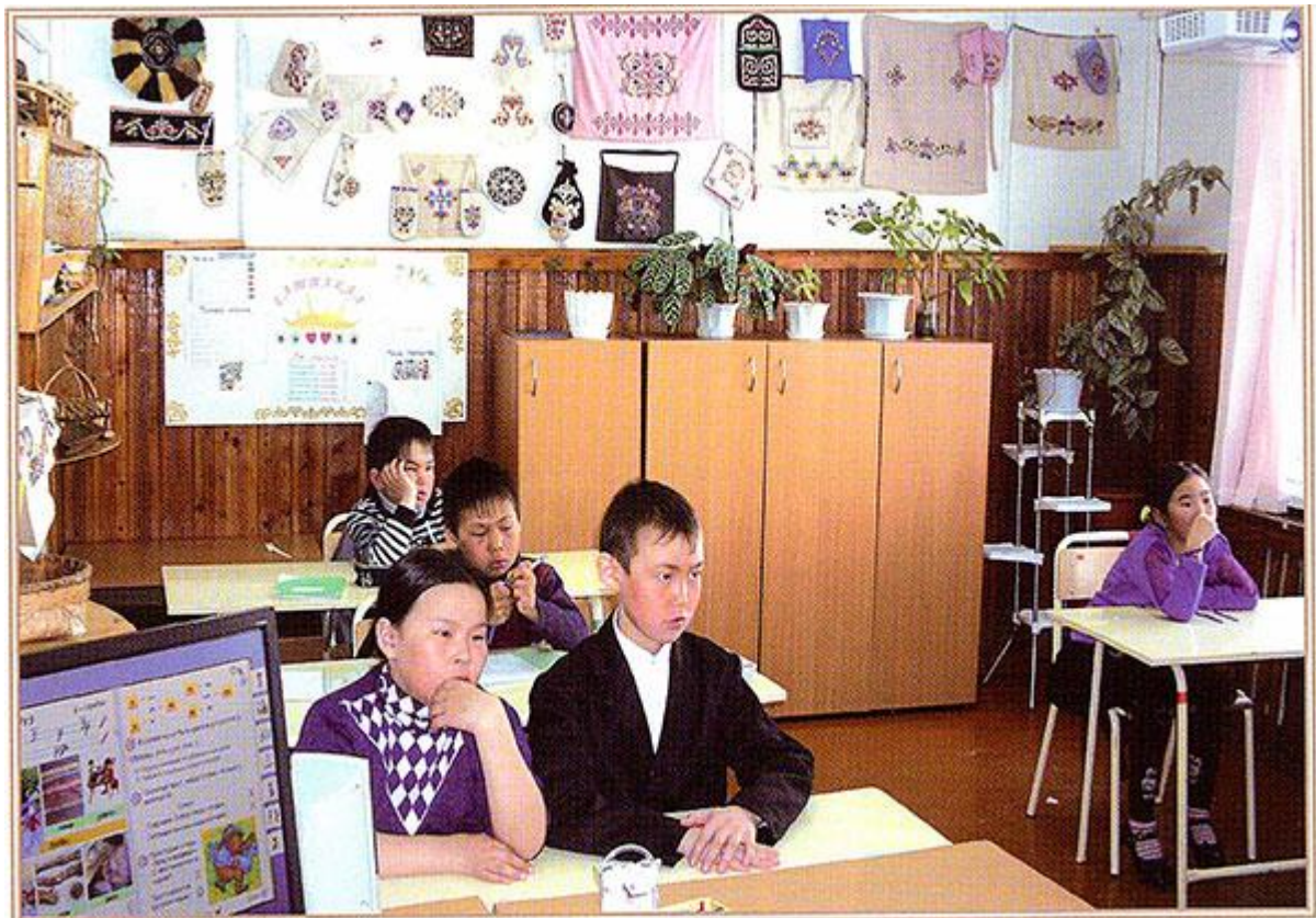
Ученики осваивают электронный учебник по негидальскому языку, 2010г.

Пособие рассчитано на широкий круг потребителей: дошкольные, школьные, внешкольные учреждения, учреждения культуры, организующие обучение «родным языкам», а так же на физических лиц, желающих самостоятельно изучать «родной язык».